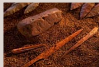
BLOMBOS CAVR: 100 000 år gammel steinkunst fra Blombos Cave i Sør-Afrika. Et av bevisene på tidlig menneskelig aktivitet i området.

UiB er faktisk ikke i en dårlig posisjon til å lede an i en slik videreutvikling, men det fordrer meningsutvekslinger på tvers av universitetet og at man enes om et felles mål: at studentene skal lære å vurdere og verdsette flere perspektiver. Vi har stor bredde i våre fagdisipliner, vi har allerede en portefølje av dannelsesemner og vi har toppsentre innen forskning på livets opprinnelse, menneskehetens opprinnelse og hjernens funksjoner. ◦